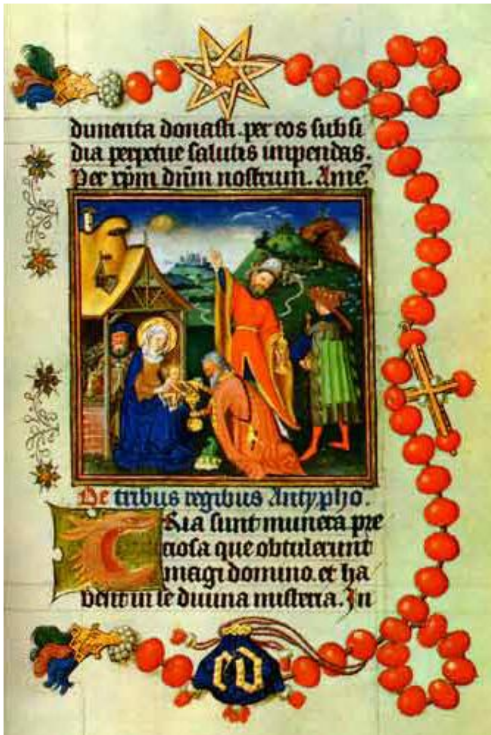
Ur Catherine of Cleves (1417–1479) bönbok