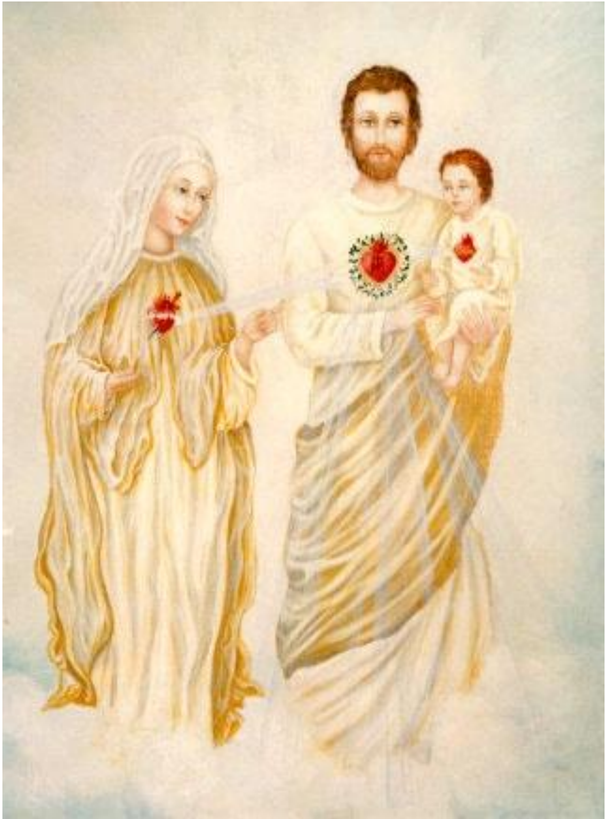
Bilden ritades av Edson Glauber efter en vision av Jesu Heliga Hjärta, Marie Obefläckade Hjärta och Josefs Kyska Hjärta år 1996