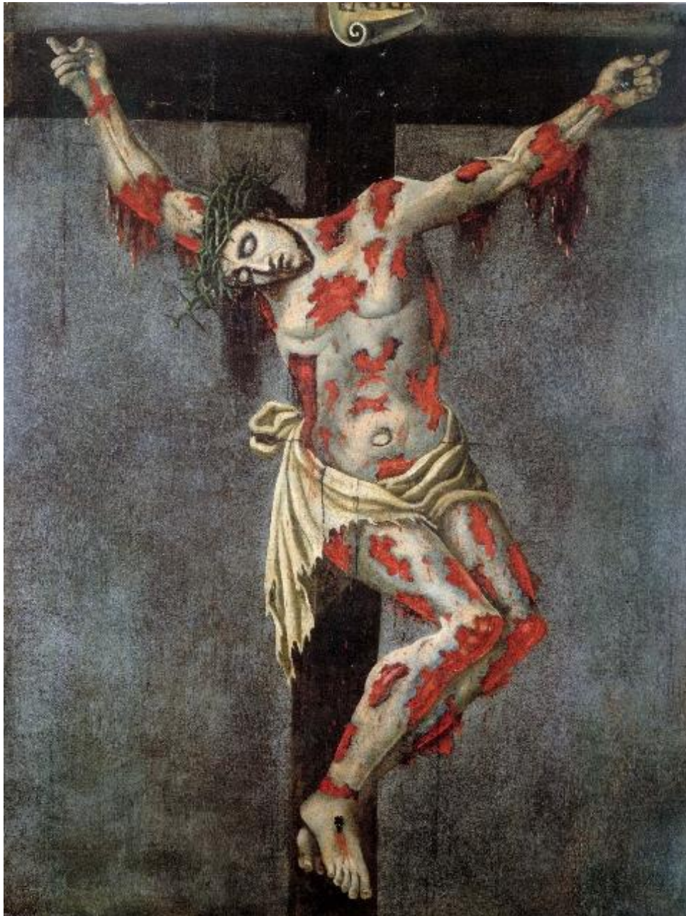
Helige Alfons Maria dei Liguori målade denna bild av den Korsfäste år 1719