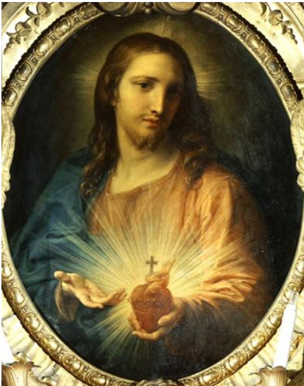
Jesu Heliga Hjärta målat år 1760 av Pompeo Giraolamo Batoni. Originalen vördas i Jesuiternas huvudkyrka Il Gesù i Rom